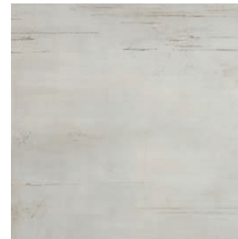
CXE710 KRONOS 60x60 GRIS