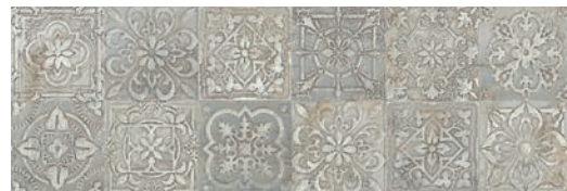
CZP990 TEMPO 30x90 IRIS