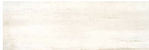
CSH670 KRONOS 30x90 MARFIL