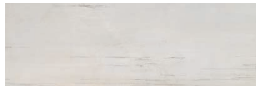
CSH710 KRONOS 30x90 GRIS