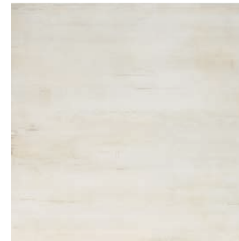
CXE670 KRONOS 60x60 MARFIL