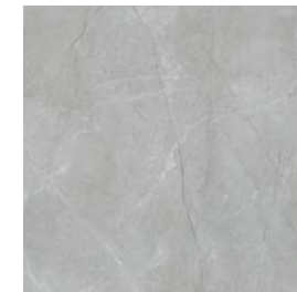
GYS770 MYTHOS 60x60 GRAFITO MATE