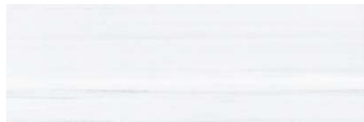
JKX515 ETERNAL 40x120 BLANCO BRILLO