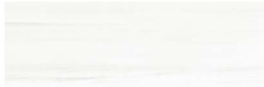
JKX535 ETERNAL 40x120 BLANCO MATE