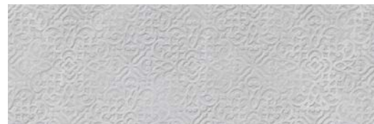
JKY710 FENICIA 40x120 GRIS