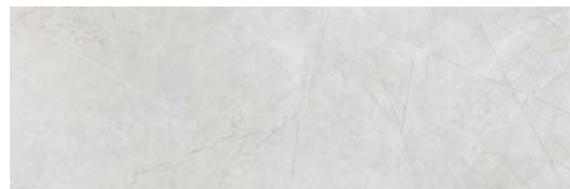
JKZ735 MYTHOS 40x120 GRIS MATE