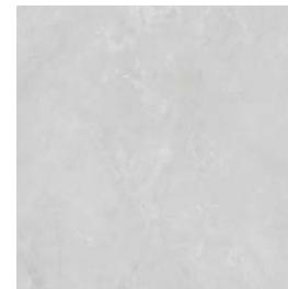
GYS735 MYTHOS 60x60 GRIS MATE