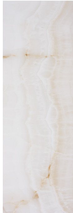
JKJ610 DOREX 40x120 B44 BEIGE