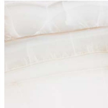
DNK610 DOREX 58,5x58,5 BEIGE B19