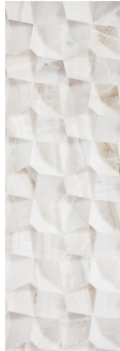
JKK990 VARY DOREX 40x120 B45 IRIS