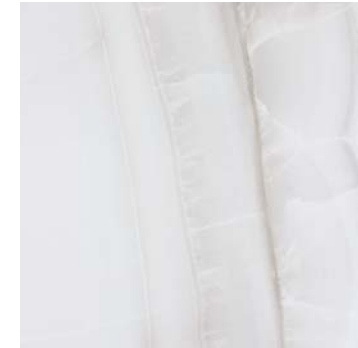
DNK710 DOREX 58,5x58,5 GRIS B19

DL9505 L. METAL 1,5x120 ACERO BRILLO P19